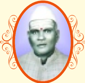
ಡಿ|| ಬಿ.ಸಿ. ರುದ್ರಪ್ಪ