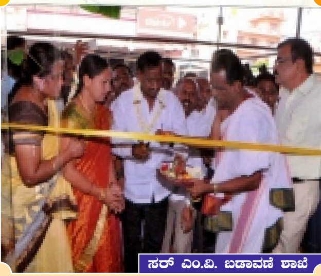
ಸರ್ ಎಂ.ವಿ. ಬಡಾವಣೆ ಶಾಖೆ