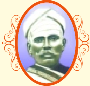
ಡಿ|| ಬಿ.ವಿ. ಚೆನ್ನಪ್ಪ