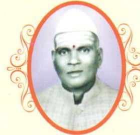
ಡಿ|| ಬಿ.ಸಿ. ರುದ್ರಪ್ಪ