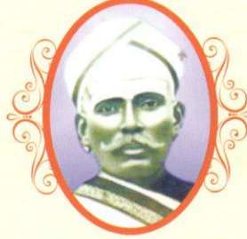
ಡಿ|| ಬಿ.ವಿ. ಚಿನ್ನಪ್ಪ